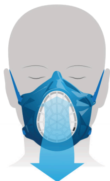
Masque AirCare Plus : Ajustement précis