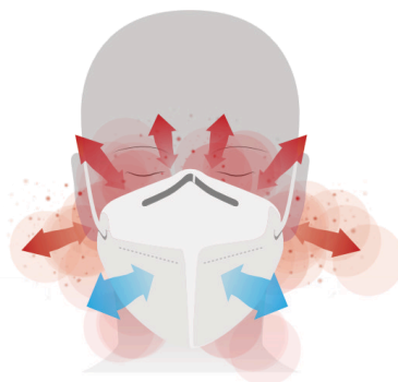
Masques standard : Fuites latérales