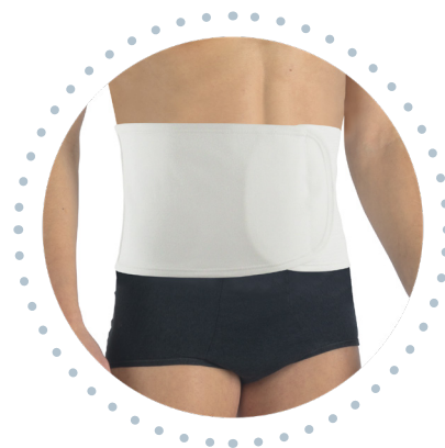
Modèle hauteur 18 CM