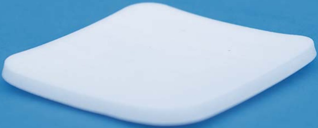
Wundauflage mit Rand